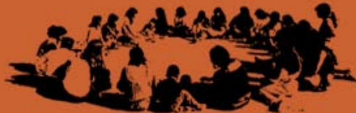
ENCONTRO DE MULHERES GUARANI DO LITORAL NORTE DO ESTADO DE SÃO PAULO